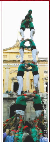
Castellers de Sant Pere i Sant Pau