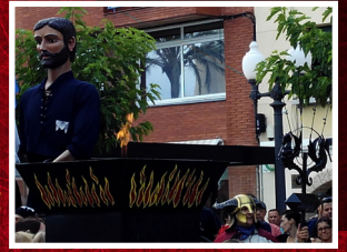
Autor: Okera PC

Organitza: Colla Diables Voramar del Serrallo - Víbria de Tarragona