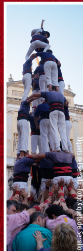
Xiquets de Tarragona

Tarragona, Xiquets del Serrallo i Castellers de Sant Pere i Sant Pau. Amb el sistema de rondes a la tarragonina, cada colla intervindrà per torn rotatiu, decidit prèviament per sorteig. La diada constarà de tres rondes; la colla que no completi les tres construccions pot arribar a fer fins a dues tandes més, havent d'intentar construccions superiors a les ja bastides i mantenint sempre l'ordre sortejat.