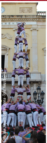
Colla Jove Xiquets de Tarragona - Foto: Lleus Lleusa

Tarragona, Xiquets del Serrallo i Castellers de Sant Pere i Sant Pau. Amb el sistema de rondes a la tarragonina, cada colla intervindrà per torn rotatiu, decidit prèviament per sorteig. La diada constarà de tres rondes; la colla que no completi les tres construccions pot arribar a fer fins a dues tandes més, havent d'intentar construccions superiors a les ja bastides i mantenint sempre l'ordre sortejat.