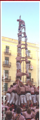
Xiquets de Tarragona

19.30 h , pl. de la Font. Castells amb les colles de la ciutat: Xiquets de Tarragona, Jove Xiquets de