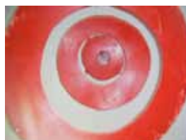
► Ad infinitum 2002