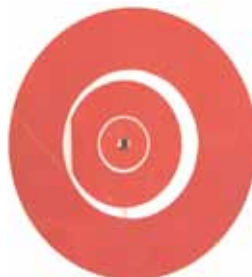
► Ad infinitum 2002

A l'exposició vam escollir les obres que els van cridar més l'atenció i les vam treballar a l'escola.