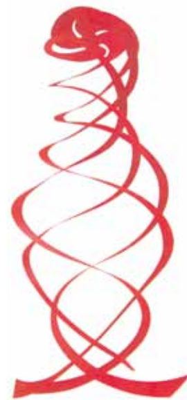
► Red helix 2001