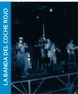
LA BANDA DEL COCHE ROJO