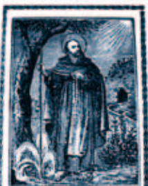
Sant Magí Martir Gileois que s' venera en sa propia Capella de la Ciutat de Gersens