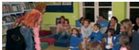
Bon profit. Contes de cuina Contes petits com un gra de mill Contes d'Àfrica Contes de llops

Contes de cuina per a nens i nenes a partir de 5 anys, contes "petits com un gra de mill" per a nens i nenes de fins a 7 anys, contes africans per a nens i nenes a partir de 6 anys i, finalment, contes de llops per a nens i nenes a partir de 5 anys. Totes les sessions es faran a les sis de la tarda a la Sala Infantil de la Biblioteca.