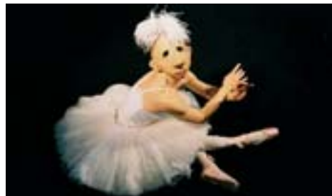
La Festa de l'Espectacle 2006, Premis Públics i Teatro Delusio

El període de votacions dels Premis finalitza el 10 de maig. Els lectors que vulguin participar en la selecció dels premis poden utilitzar la butlleta que es reproduïx a la pàgina 6 d'aquesta publicació.