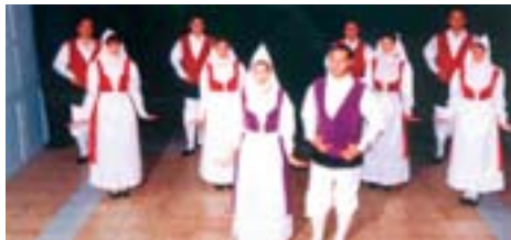
Dissabte 20 de maig Festival 500 Teatre Matropol 19.30 h

El diumenge 7 de maig, el parc de Saavedra acollirà la XXXIV edició del popular Aplec de la Sardana Ciutat de Tarragona. L'Aplec començarà a les 10 del matí al mateix parc, i la ballada de sardanes serà a les 4 de la tarda. Les cobles participants a la ballada seran la Cobla Reus Jove, la cobla Ciutat de Terrassa i La Principal de Tarragona. L'acte l'organitza l'Agrupació Casal Tarragoní.