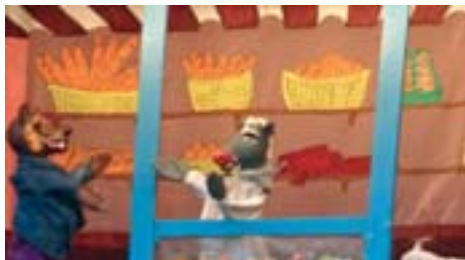
Les 7 cabretes i el llop