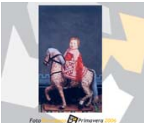
Foto Tarragona Primavera 2006

I és que "El nen i la joguina" és un retrat doble que continua vigent, ja que un és l'extensió de l'altre i, a més, un clar testimoni de quines han estat les joguines de moda al llarg del segle, així com la roba i l'evolució del gènere del retrat.