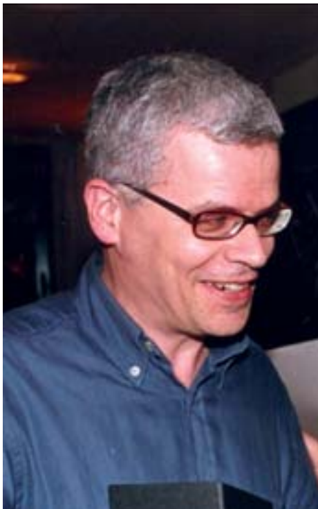
XIII Trobada d'Escriptors del Camp de Tarragona

Cavallé va començar a escriure als set anys, quan va fer la seva primera novel·la -que no va acabar-, i als tretze ja va escriure la primera obra de teatre. Des d'aleshores la seva producció literària és intensa i diversa. És autor, entre altres, de L'espiral. Exercici d'autofàgia (premi Salvador Reynaldos de teatre inèdit 1986), Dinastia Ming (Premi Crítica Serra d'Or a la millor obra editada o estrenada durant el 1999), Rei de mi (premi Ciutat d'Alzira de novel·la 1993) i Les flors verinoses (editada per Edicions 62 el 1990). Un llarg i interessant itinerari artístic que es podrà recórrer durant la Trobada d'Escriptors.