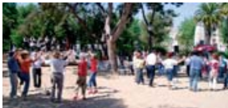
Diumenge 7 de maig Aplec de la Sardana Parc de Saavedra 10 h