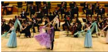
Gran Concert de Cap d'Any