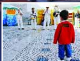
La ciutat dels nens