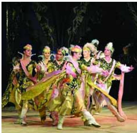
Ballet de Sant Petersburg

El Trencaous és l'altra peça que interpretaran amb la música de Txaikovski i els contes de Hoffmann del mateix títol. Una història de sentiments contraposats com la tristor i l'alegria.