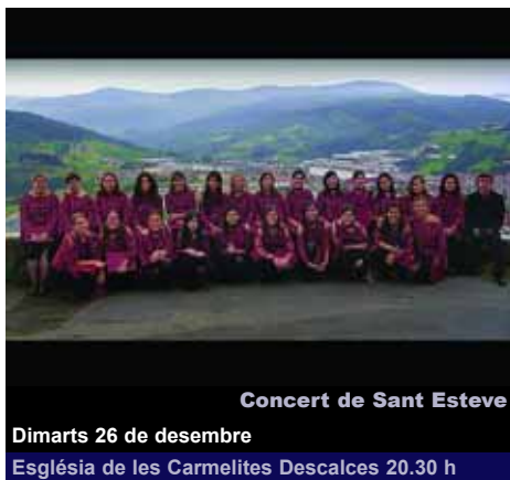
Concert de Sant Esteve