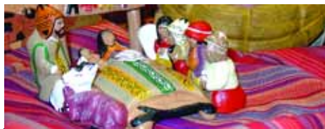
2a Setmana del Pessebre

L'altra aposta ens la proposa Intermón Oxfam, i és l'extensió de la 1a Setmana del Pessebre. En aquesta exposició es mostren pessebres de llocs tan diversos com el Perú, Bangla Desh, Sri Lanka o Indonèsia, que recullen l'essència de la cultura de cadascun d'aquests països adaptades a les figures. Tots els pessebres, que han estat elaborats sota els criteris del comerç just, es posaran a la venda durant les dates de l'exposició i en les setmanes següents.