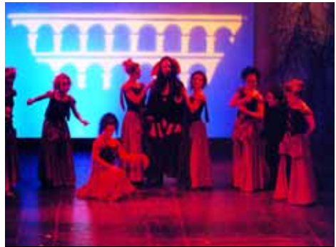
Els Pastorets de Tarragona

L'espectacle respecta el fons dels Pastorets originals combinant-ho amb les formes i els diàlegs del segle XXI, en un espectacle que aporta nous atractius com l'aparició de personatges coneguts, la música en directe, l'ambientació tarragonina i la sàtira relacionada amb temes d'actualitat. Aquesta combinació fa de l'obra un espectacle molt tarragoní, adreçat tant a grans com a petits.