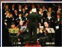
Nadal en solfa