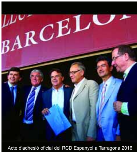
Acte d'adhesió oficial del RCD Espanyol a Tarragona 2016

Finalment, representants de quatre anteriors Capitals Europees de la Cultura van visitar Tarragona el passat novembre per explicar la seva experiència en el desenvolupament de les capitals europees de la cultura.