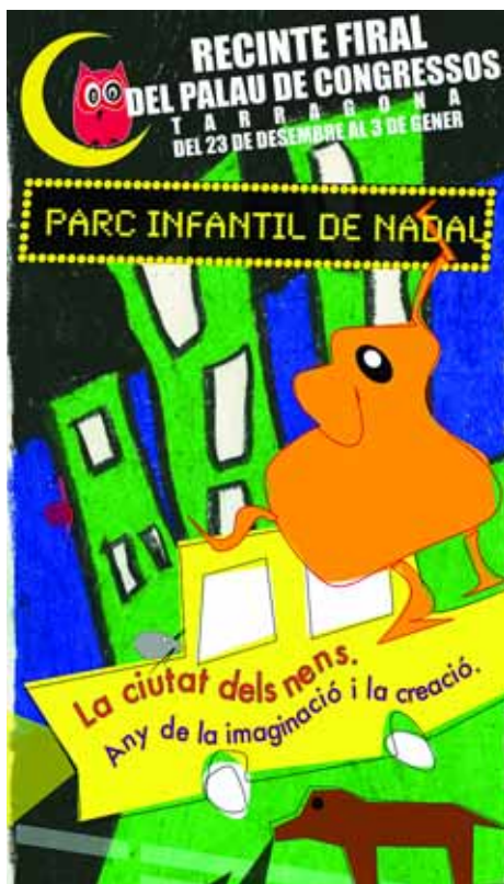
Parc Infantil de Nadal

L'obertura de portes es farà el 23 de desembre a les 11.30 h (una hora després s'inaugurarà oficialment), amb un espectacle inaugural, i estarà obert fins al 3 de gener (excepte el 25 i l'1 al matí, que romandrà tancat).