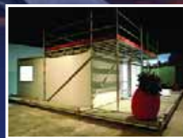
Margalef, al Tingaldo 2