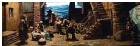
Associació Pessebrista de Tarragona