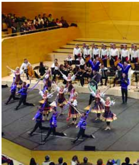
Cor, Ballet i Orquestra de l'Exèrcit Rus

El grup de ballet està format per més de quaranta artistes i sorprèn per les seves originals coreografies i l'impressionant vestuari. Entre el seu repertori hi podem trobar àries d'òperes clàssiques com Il trovatore i Rigoletto de Verdi o La Bohème de Puccini.