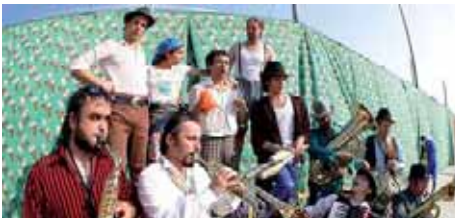
12è aniversari de La Vaqueria