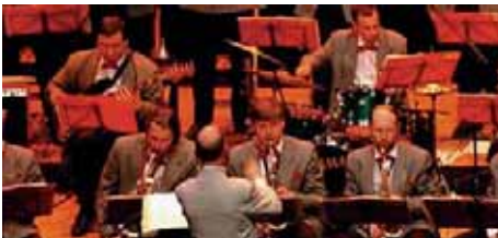
Glenn Miller Tribute