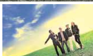
Lagartija Nick: el mite arriba a Tarragona