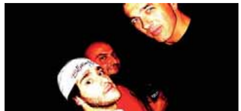
Palo de Ciego

La Vaqueria també serà l'escenari del directe de la banda de rock Palo de Ciego. Avalats per la seva trajectòria, presenten un cop més les seves cançons compromeses, temes que tracten de la vida quotidiana. Un bon repertori, ben treballat, que posarà punt final a una temporada d'estiu plena de concerts que els han portat per diversos festivals, on han compartit escenari amb bandes de renom nacional. Amb les idees clares, el grup ja està pensant en l'enregistrament d'un disc. Per tant, aquest no serà un concert més, sinó un avanç del que finalment editaran.