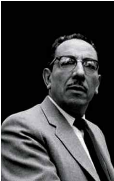
Seminari Artur Bladé i Desumvila