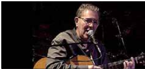
Pi de la Serra