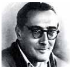
Els colors d'en Serra

L'accés és lliure però cal recollir la invitació, ja que hi ha un aforament limitat.