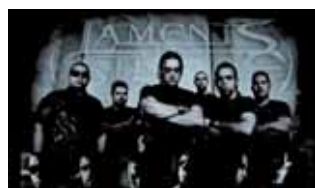
Parlem amb els guanyadors del DO TGN 07