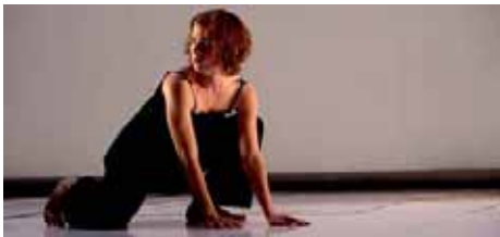
Rober y Tober