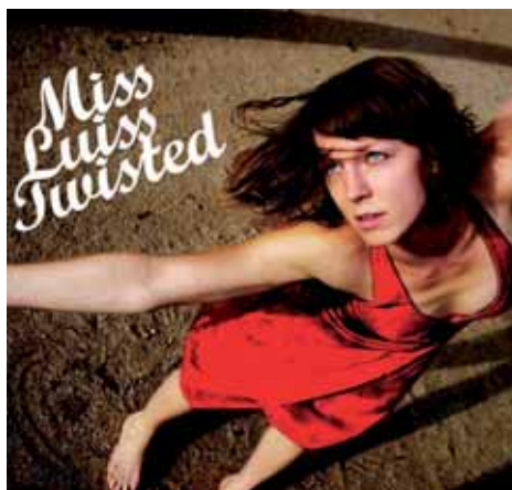
Lo que es , de Miss Luiss Twisted i Gozari Goxo , d'Eneko Alcaraz Dijous 7 de febrer Sala Trono 21.30 h 6€

Gozari Goxo (Esmorçar dolç) neix del plaer de despertar-se sense cap pressa, sense despertador, amb una carícia o un raig de sol per quedar-se despert al llit recordant els somnis fins que la gana t'aixeca i et prepares per a un gran esmorzar. L'obra compta amb els mateixos intèrprets que Lo que es .