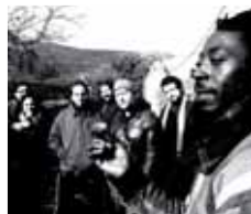
Malabo Roots i Sound Sistem