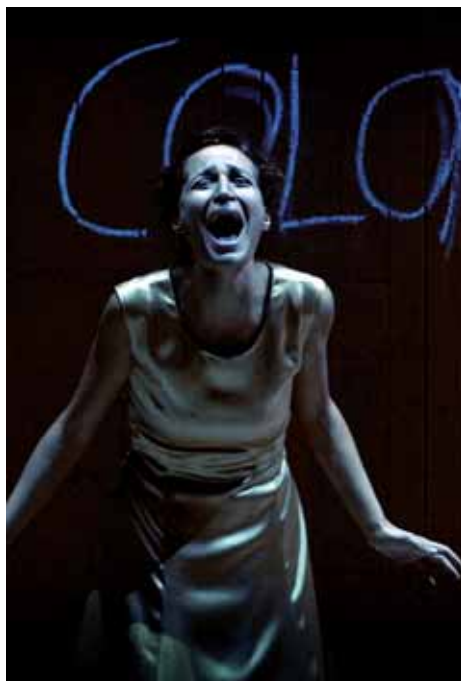
La plaça del Diamant, de Mercè Rodoreda

Mercè Rodoreda va néixer el 10 d'octubre de 1908 a Barcelona i va morir a Girona el 13 d'abril de 1983. Va ser filla única d'un matrimoni amant de les lletres, i la seva infantesa va estar influenciada per la figura del seu avi matern, Pere Gurguí, que li va inculcar un profund catalanisme que la va acompanyar durant tota la vida. Rodoreda va iniciar-se en la literatura amb col·laboracions en diversos mitjans com La Veu de Catalunya , La Publicitat o Mirador . Amb la Guerra Civil va exiliar-se a Ginebra, i va ser aquí on va escriure el 1960 La plaça del Diamant .