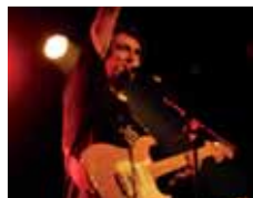
El Sobrino del Diablo

Músic de rock, cantautor, escriptor i monologuista de Barcelona. El Sobrino del Diablo té quatre discos al mercat editats per la discogràfica K Indústria Cultural, l'últim dels quals és El Cuarto de la Ratas . Els seus directes barregen textos divertits i irònics amb un teixit musical molt variat. Les fonts són tan diverses com el folk, el rock dels 70, el blues o el reggae. La posada en escena és genial.