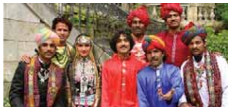
Dhoad Gypsies from Rajasthan