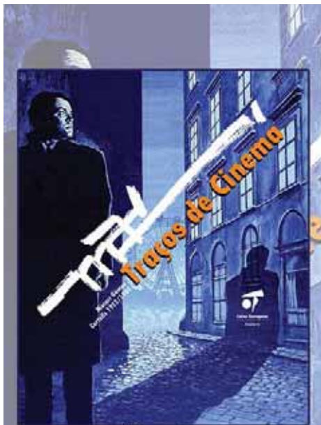
"MAC: Traços de cinema"

Amb "Mac: Traços de cinema" la Fundació Caixa Tarragona continua apostant per la reivindicació d'artistes del territori tarragoní.