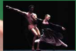
Arriba la Compañía Nacional de Nacho Duato