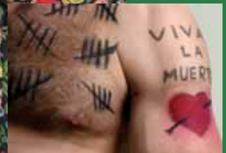
Calixto Bieito revisa Èsquil a 'Los persas'