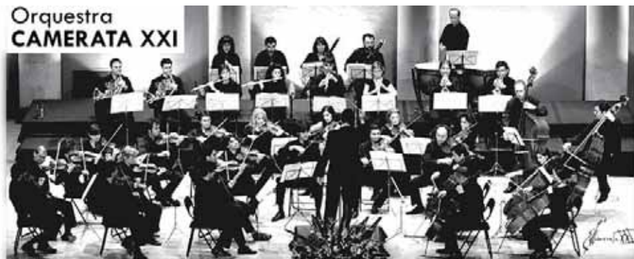
Orquestra CAMERATA XXI

PRESENTACIÓ L'ORQUESTRA PROGRAMACIÓ REPERTORI ALBUM CONTACTAR