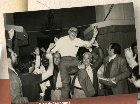
Fons Diari de Tarragona