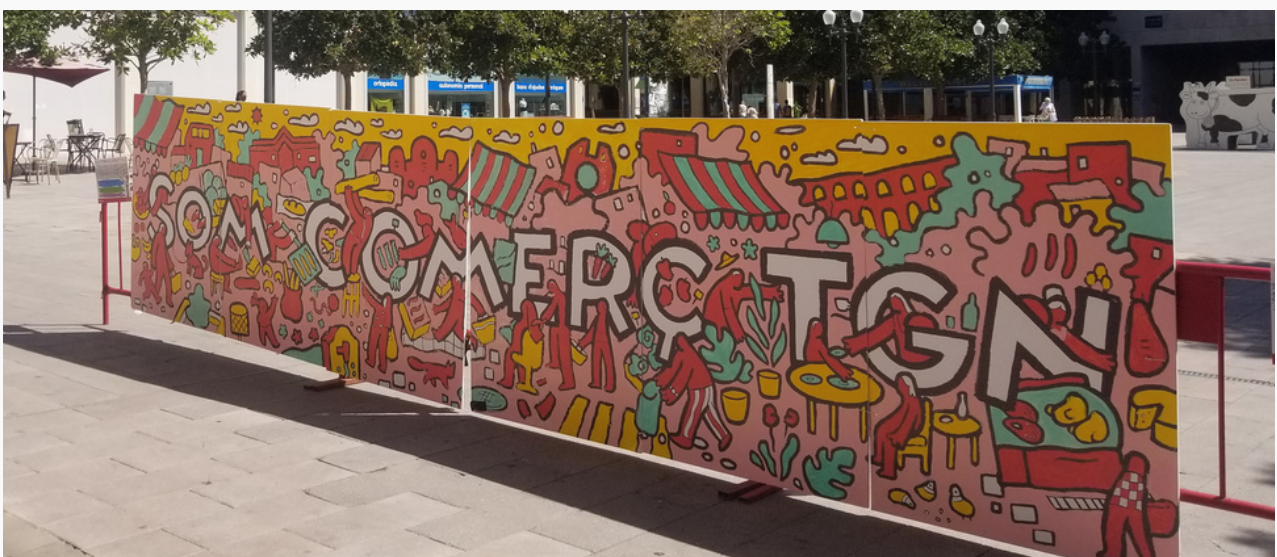
Foto: Mural pintat pels infants de Tarragona durant les festes de Sant Magí en suport al comerç local

En breu podreu fer-hi les inscripcions, que seran limitades per respectar les mesures higièniques i de seguretat derivades de la covid-19.