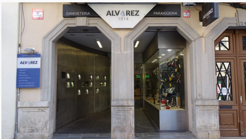
La Ganiveteria Àlvarez s'ubica al carrer Colom des del 1985.