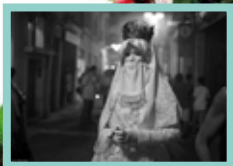
Santa Tecla 2015

19.30 h, Casa de la Festa, Via Augusta. Inauguració de l'exposició fotogràfica "La Festa als Ulls d'Antonio Nodar".