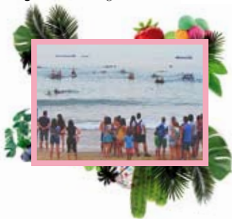
Travessa d'Andròmines / Alverna

11 h, platja del Miracle, a la zona més propera a la punta del Miracle, fins a les 13 h. VII Travessa d'Andròmines de Sant Magí. Per a tarragonins i tarragonines amb esperit mariner i aventurer. Només cal construir algun artefacte que suri i ganes de divertir-se. També hi haurà la tradicional Travessa Infantil i el Concurs de Fotografia de la Travessa. Informació i inscripcions: www.androminestarragona.com i travessa@androminestarragona.com