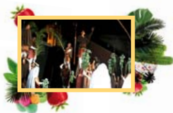
Les Contalles de Sant Magí Esbart Santa Tecla

22.30 h, plaça de la Pagesia, vora l'Antic Escorxador. Dansa. Esbart Santa Tecla: Les Contalles de Sant Magí. La vida del copatró de Tarragona, presentada a tra-