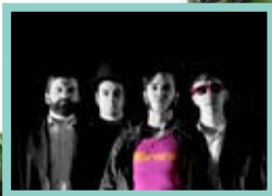
Obeses