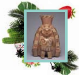
L'art mochica de l'antic Perú. Or, mites i rituals

Perú. Or, mites i rituals 9 . En català. Places limitades. Venda anticipada. Organitza: CaixaForum