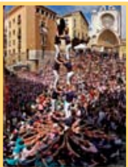
2 de 7 Xiquets del Serrallo / F. Virgili