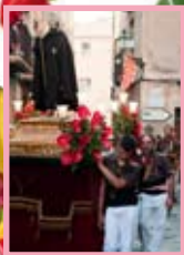
Professó de Sant Magí / Pep Escoda

19.30 h , des del Portal del Carro. La Professó de Sant Magí , en la qual els integrants del Seguici precedeixen la creu processional acompanyada per dos cirials, els infants representant la persecució i martiri de sant Magí pels soldats romans, els penons corporatius, els Ministrers de la Ciutat de Tarragona que acompanyen la imatge del sant —seguint compassadament el so dels tabals— i el clergat.