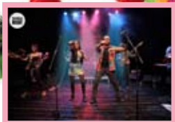
Orquestra Alliola Orquestra La Golden Beat

23.30 h, plaça de la Font. Revetlla amb les orquestres Alliola i La Golden Beat. La nit més ballable de Sant Magí, a la plaça ineludible en ocasions com aquesta.