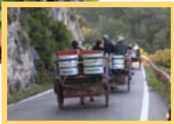
Baixada de l'aigua de Sant Magí Manel R. Granell

Amb les primeres clarors del dia, des de Sant Magí Lluny, el santuari de la Brufaganya. L'arrencada dels portants