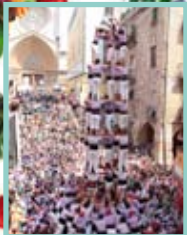
5 de 9 f Colla Jove Xiquets Tarragona Dani Sero

12 h, passeig de les Palmeres. Sant Magí Street Food . Una gran i diversa oferta gastronòmica amb concerts, food trucks i activitats infantils i familiars durant tot el dia.