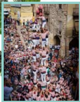
4 de 9 f Xiquets de Tarragona

12 h, plaça de les Cols. Castells, torres i pilars, amb els Xiquets de Tarragona, la Jove Xiquets de Tarragona, els Xiquets del Serrallo i els Castellers de Sant Pere i Sant Pau. Cada colla intervé per torn rotatiu, decidit per sorteig. L'actuació consta de tres rondes, però la colla que no completi les tres construccions pot arribar a fer dues tandes més, mantenint l'ordre sortejat, i en la darrera ha d'aixecar construccions superiors a les ja bastides. Els pilars tanquen l'exhibició. En finalitzar, toc de vermut amb els grallers i els timbalers de les colles.