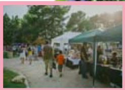
Mercat d'Artesania / Albert Rué

17 h, Camp de Mart. iMAGInARTE - mercat d'artesanía i art. Productes d'artesanía i art durant tota la tarda i fins a la 1 h. Dibuixants, il·lustradors, grafiters, objectes de disseny, artesans, bijuteria... Hi podreu trobar exposats articles de proximitat, ecològics i singulars de creació artística, enfront de la producció uniformitzada de la indústria. Productes d'artesanía pròpia!