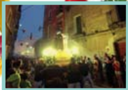
Entrada de Sant Magí

Carro , amb el potent, tossut i persistent acompanyament del foc pirotècnic i els trons de la Pirotècnia Igual de Canyelles (Garraf), que culminarà quan la petita imatge s'endinsi pel Portal del Carro. Tot seguit, un cop el sant hagi entrat, des de la plaça de la Pagesia, pujada dels pilars caminant de les colles castelleres per ordre d'antiguitat.