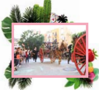
Arribada de l'aigua de Sant Magí Manel R. Granell

18 h , ctra. de Santes Creus, c. Rovira i Virgili, Rambla Nova, c. Sant Agustí i c. Portalet. L' Entrada a Tarragona de l'aigua de Sant Magí amb els carros enramats.