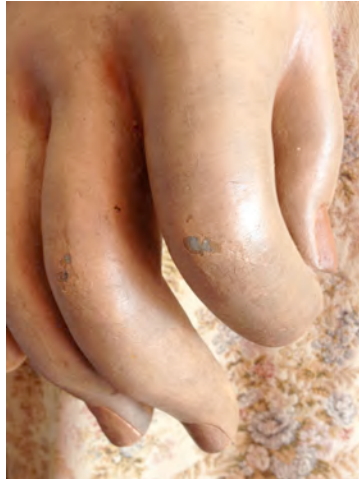
Imatge 15: Detall de la mà dreta de la geganta i de la seva delicada disposició dels dits.

El vestuari, joieria i perruqueria ( depenent de l'estat en que es trobi ) que presenten actualment els gegants, passaran a vestir al seu moment als Gegants Moros originals de Bernat Verderol, en un estat actual molt deteriorat i afectats per diferents patologies que ha estat motiu de queixes contínues per l'enorme valor històric i simbòlic de les peces. Abans d'aquest traspàs, al vestuari se li eliminaran elements de passamaneria i decoratius afegits recentment amb sistemes agressius per als teixits i inadequats, sense valor històric ni simbòlic i d'una mínima qualitat que distorsiona la lectura del conjunt. Serà el primer pas perquè les figures originals, després d'una restauració que asseguri la seva integritat, adquireixin per fi la seva categoria de peça museística i siguin exposats amb la dignitat i reconeixement que mereixen.