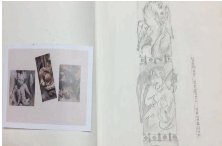
Imatge 9: Detall del diari de projecte del joier Gómez, amb les fotografies referencials de la Catedral a l'esquerra i l'esboç de la peça del Gegant a la dreta.

Aquesta relació entre Gegants i Catedral ha motivat l'artista Gómez a buscar fragments antropomòrfics en diferents parts de la Catedral, especialment en el retaule de Santa Tecla, com a referent per als elements figuratius de les peces, especialment del conjunt del Gegant, igual que per a altres motius geomètrics.