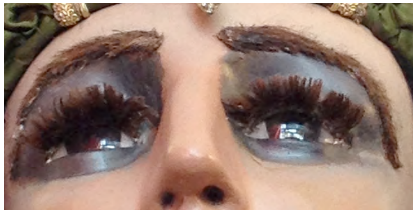
Imatge 12: Detall de les celles i pestanyes de la geganta.

Per a ella es preveu una cabellera ondulada en un 45%, la qual li donarà més dinamisme i moviment. Per al gegant, es manté una cabellera llisa. Les celles actuals dels dos, seran substituïdes pel mateix tipus de pèl i color, però buscant una forma més natural i un arc més femení per a ella i amb un aspecte més poblades per a ell. El bigoti del gegant, mantindrà la seva forma essencial: gran, caigut, espès i caigut sobre els llavis, estil que l' American Moustache Institute cataloga com de tipus walrus (morsa).