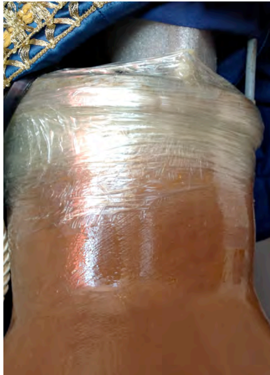
Imatge 1: Subjecció actual de la mà del gegant.