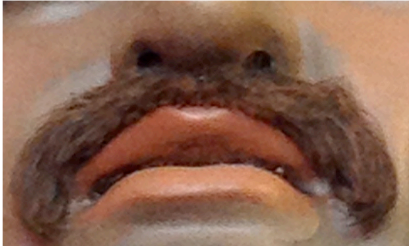
Imatge 13: Detall del Bigoti del gegant