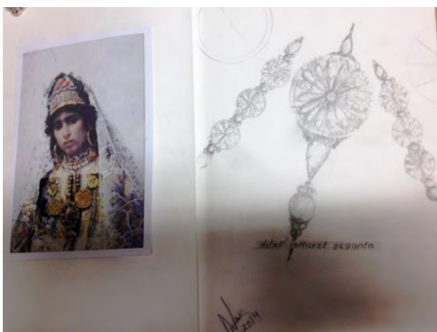
Imatge 11: Extracte del diari del projecte d'Antoni Gómez, amb l'obra de Tapiró com a referència pel disseny d'una peça de la geganta.

El resultat final serà un entrellat d'iconografia que combinarà l'essència de Tarragona, dels propis gegants, l'exotisme, el rigor històric i la creativitat de l'artista.