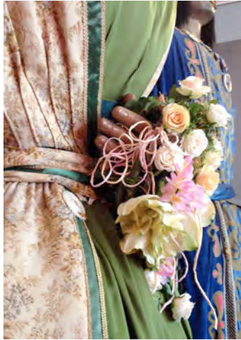
Imatge 14: Detall frontal i lateral de la postura de la mà esquerra de la geganta.