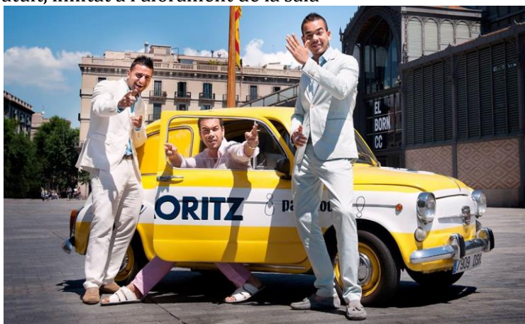
Arrels de Gràcia

Accés lliure i gratuït, limitat a l'aforament de la sala