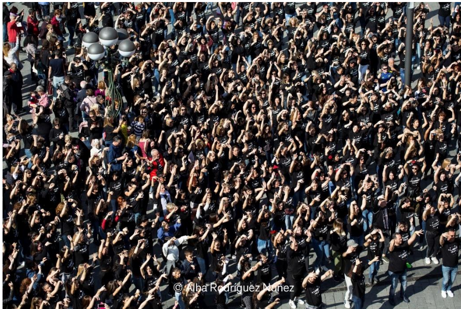
Flashmob 2019 1

Col·laboren: Art i Flamenc (Meritxell Puvill), DGG (Adelaida Guerrero), Estudio 22 (Jessy Cordero), Flamenco Azabache (Paqui Moya i Miguel A. Núñez), Wapacha (Kiko Moreno), i les escoles de flamenc de David Cano, Montse y Menchu, Mónica Novillo, África Aguilar i Tato Romero