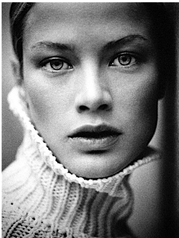
Carolyn Murphy, Zana, 1998