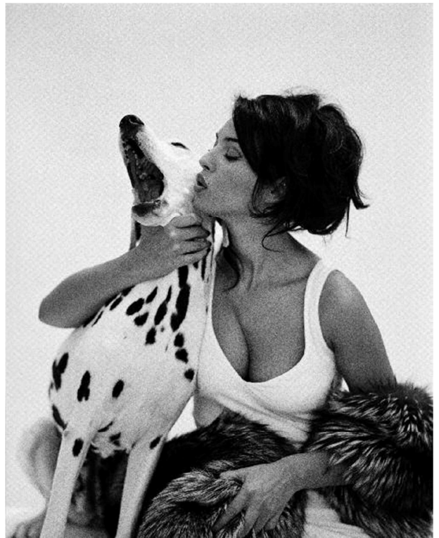
Monica Belucci, 1996