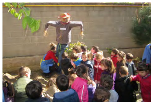
Posem a en Florenci a l'hort