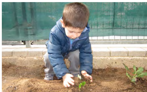
L'Eloi està plantant maduixes