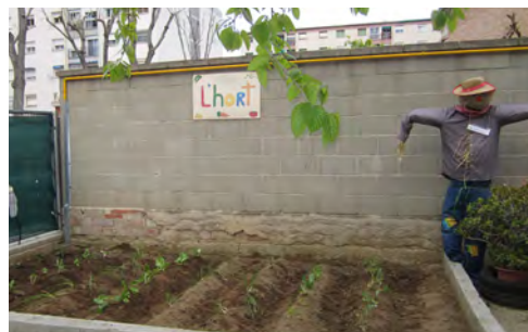
Així de bonic ens ha quedat l'hort!