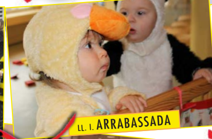
LL. I. ARRABASSADA