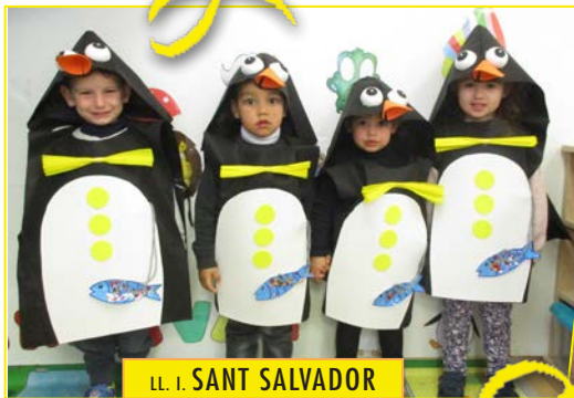
LL. I. SANT SALVADOR