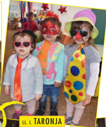
LL. I. TARONJA