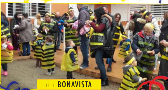
LL. I. BONAVISTA