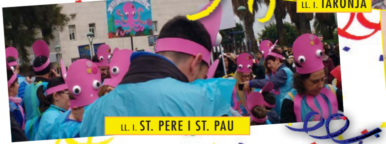
LL. I. ST. PERE I ST. PAU