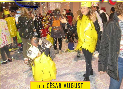
LL. I. CÈSAR AUGUST