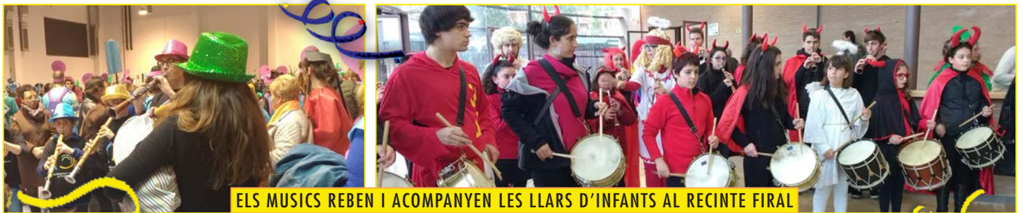
ELS MUSICS REBEN I ACOMPANYEN LES LLARS D'INFANTS AL RECINTE FIRAL