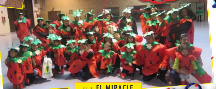
LL. I. EL MIRACLE