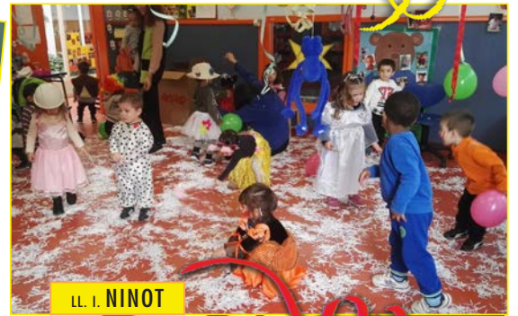
LL. I. NINOT