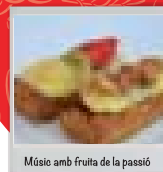
Músio amb fruita de la passió