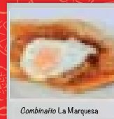
Cominatio La Marquesa