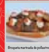
Broqueta marinada de pollastre