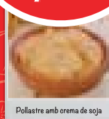
Pollastre amb orema de soja