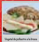
Vegetal de pollastre a la brasa