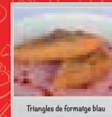
Triangles de formatge blau