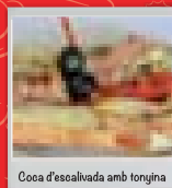
Coca d'escalivada amb tonyina