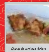
Quiche de verdures i bolets