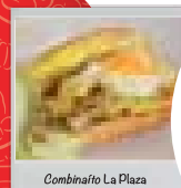
Cominatio La Plaza