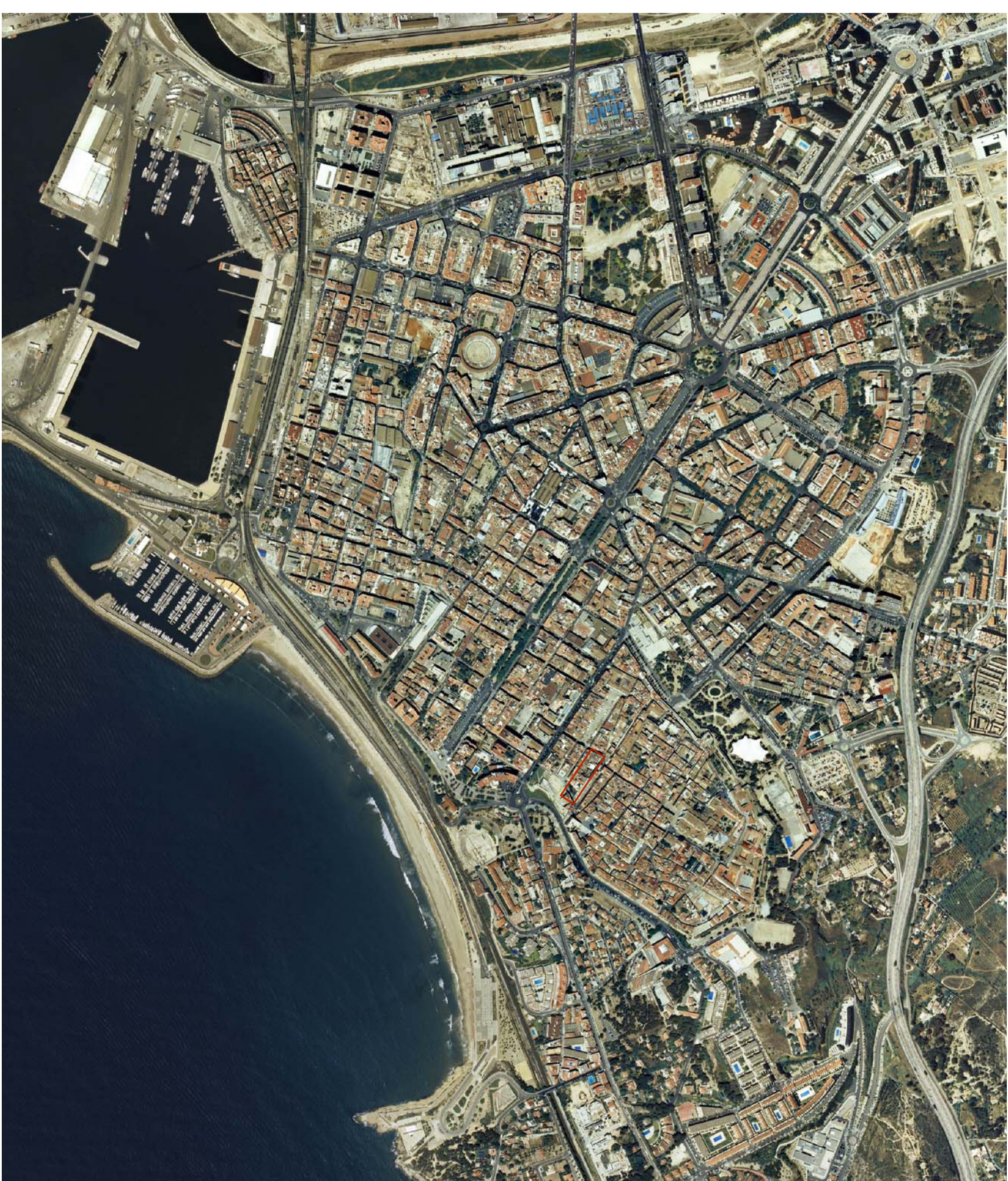
ORTOFOTO - Escala: 1/10.000