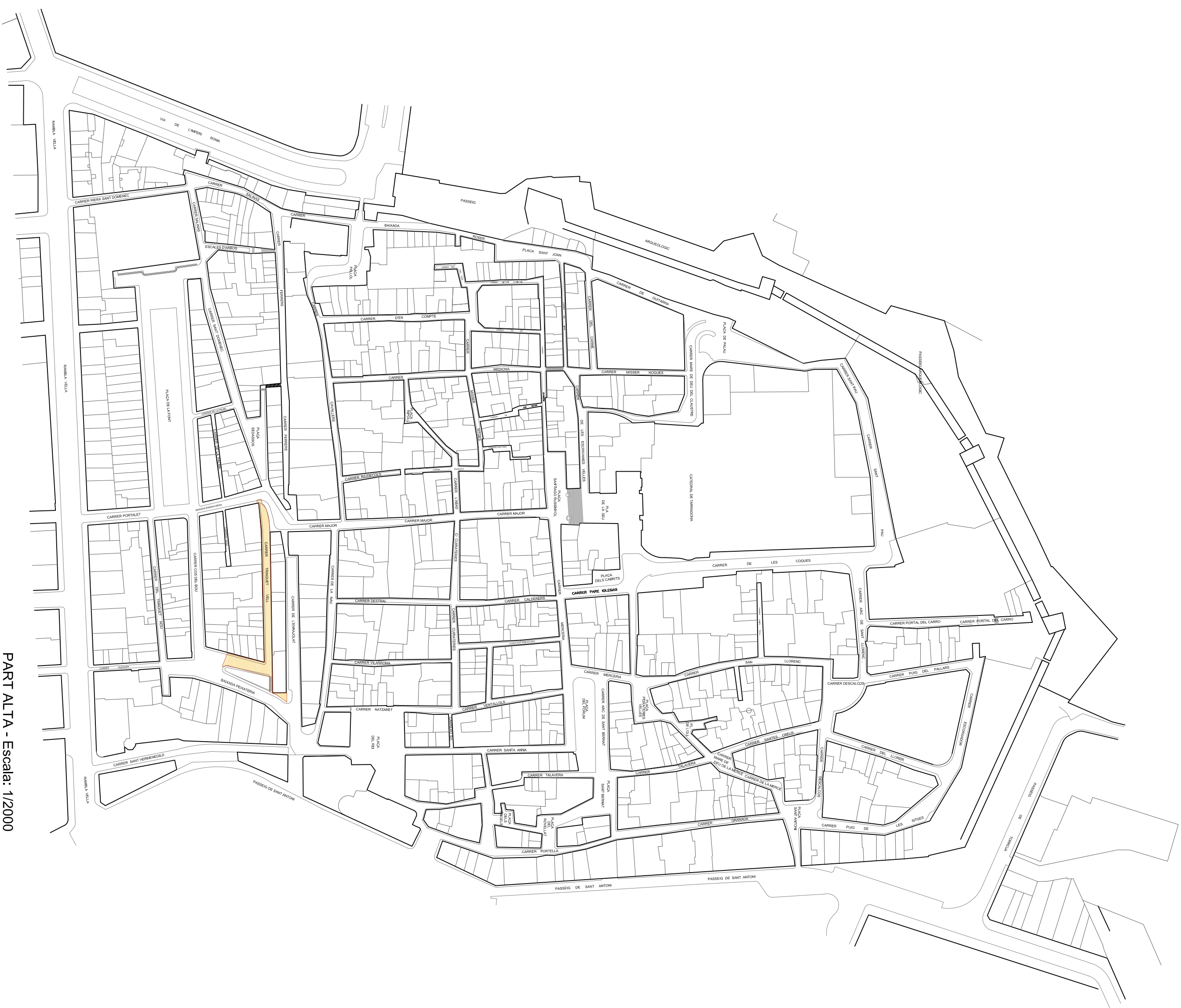
PART ALTA - Escala: 1/2000