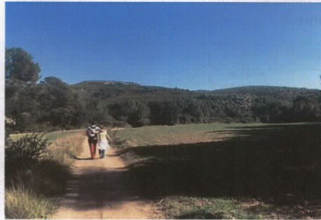
Camí entre Mas d'en Sorder i Sant Simplicí, prop del Barranc de La Móra.

A l'origen polític de l'Anella Verda hi ha la proposta del GEPEC, que ser va recollida i impulsada políticament pel grup municipal d'ERC la legislatura de 2007-11, i assumida pel conjunt del govern del PSC. Altres formacions, com ICV, duien també una proposta similar als seu programa electoral, malgrat la dissort de no entrar a l'Ajuntament. Només en aquesta legislatura, grups municipals com la CUP, el PdCat o el PSC, a més d'ERC, han presentat mocions o precis vinculats a la posada en valor de l'Anella Verda, des de l'ampliació a Ponent fins a la millora de la senyalització dels camins.