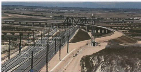
Bypass de Torrejón de Velasco.

Des del grup municipal d'ERC-MES es considera que l'objectiu que persegueix aquell acord és valuós, a saber: reduir els temps dels trens de passatgers entre l'estació urbana de Tarragona i Barcelona. No obstant, la concreció que es proposa amb el bypass del Gaià planteja importants inconvenients que cal tenir en compte i que la fan clarament pitjor que alguna de les alternatives concretes que persegueixen el mateix objectiu. En conseqüència, es proposarà mantenir la finalitat i l'instrument, però replantejant l'emplaçament.