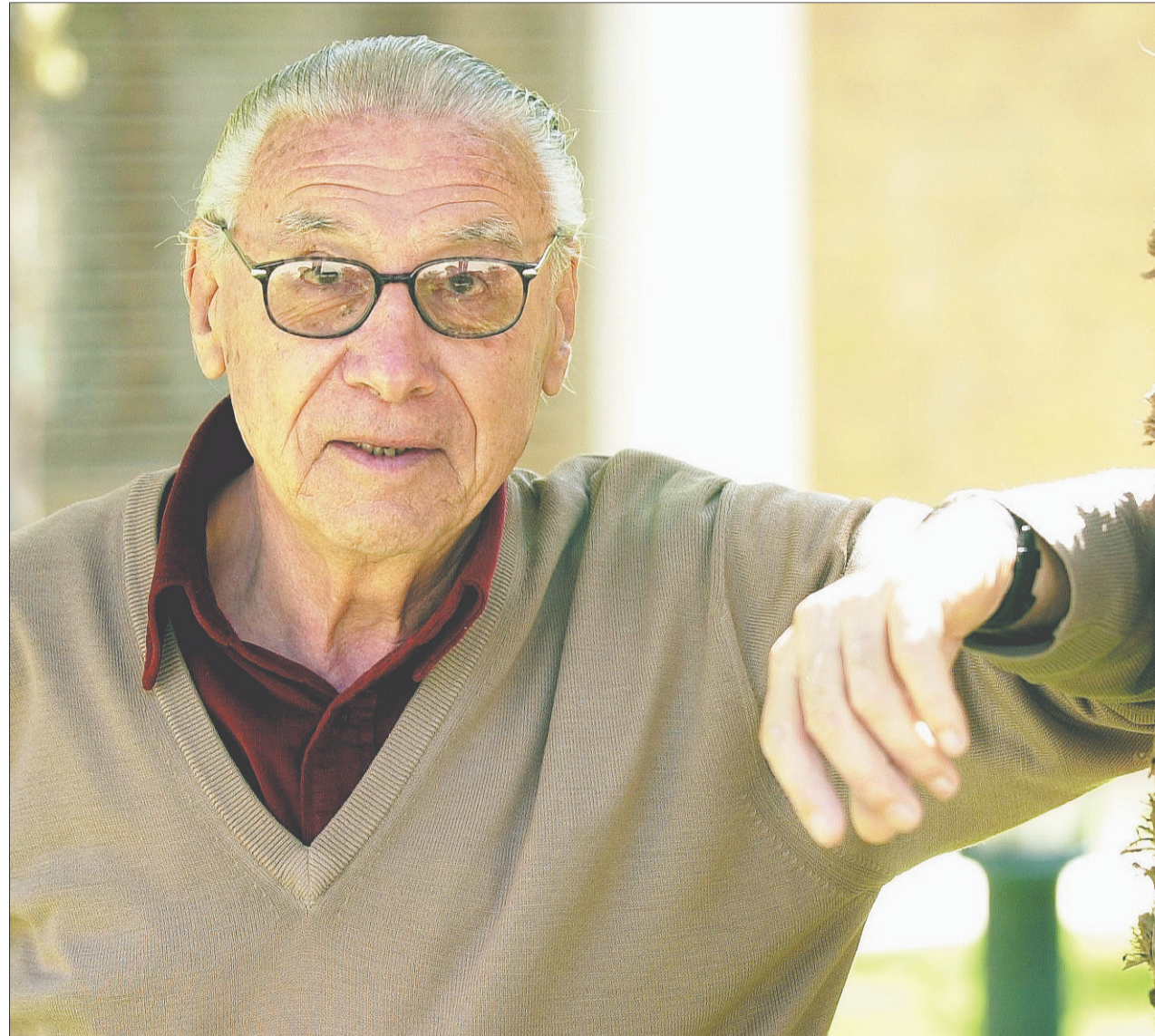
Josep Maria Recasens, en una imagen de noviembre de 2002, cuando tenía 84 años

El 10 de junio de 1987 Recasens logró su tercera –y última– victoria electoral. Sin embargo, el PSC sufrió un claro desgaste y, de hecho, el relevo no se hizo esperar,