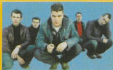
El Canto del Loco

22.30 h , envelat del Refugi 1 del Moll de Costa. Diari de Tarragona, Hit Ràdio i la Comissió del Carnaval de Tarragona presenten: El Canto del Loco + April Fool's Day. Aquell grup que va extreure el seu nom de la cançó El canto del gallo , de Ràdio Futura, per expressar-los la seva admiració i les seves influències, han demostrat amb A contracorriente que ja no són solament una promesa. Un directe fantàstic d'un grup que triomfa a les llistes però —com afirmen els crítics— sense ser necessàriament tou. Entrades ja a la venda a les taquilles del Teatre Metropol i a les botigues de discos. Preu: 16 €. Preu anticipat amb carnet jove: 14 €.