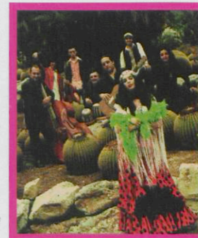
*Ojos de Brujo

Recinte de Carnaval al Moll de Costa . Diari de Tarragona, les cadenes 40 Principals, Dial i Ser i la Comissió del Carnaval presenten Ojos de Brujo en concert + Zulu 9.30 . La banda senyera del nou flamenc-hop barceloní destapa el seu tercer àlbum, Techarí , en el qual es mouen entre el hip-hop i la música afrocubana: mestissatge de primera. Venda d'entrades a les taquilles del Teatre Metropol, a les botigues de discos Arsis y Buho's de Tarragona i Quik de Reus i les 24 hores al Servicaixa, al telèfon 902 33 22 11 i per Internet a www.servicaixa.com . Preus: 18 €, anticipat; 16 €, anticipat amb Carnet Jove; 20 €, porta.