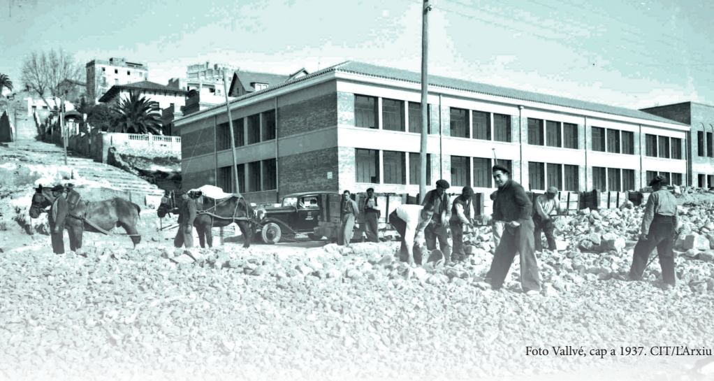
cap a 1937.