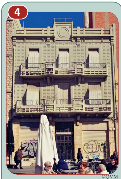
CASA ICART / CASA PORTA

L'evolució es pot seguir en un passeig breu des del Mercat fins la Rambla Nova.