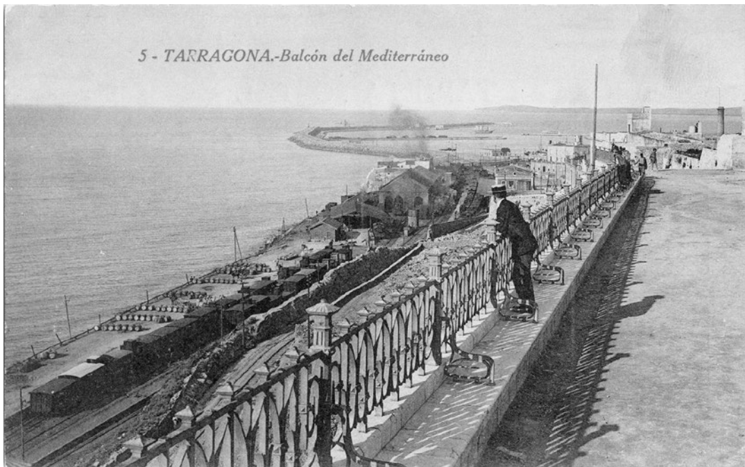
5 - TARRAGONA.-Balcón del Mediterráneo