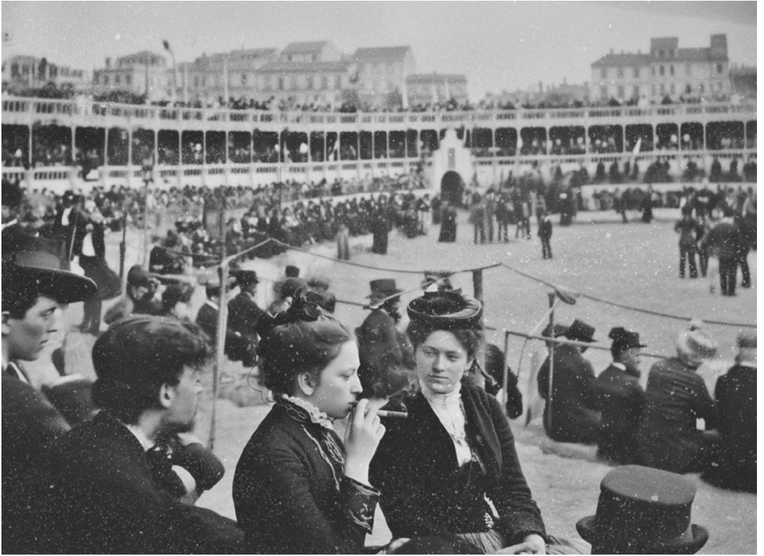
Plaça de bous. Festa patronal amb homes i dones divertint-se