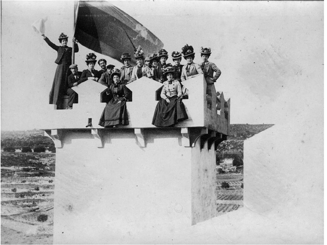
Grup de dones vestides amb indumentària de finals del segle XIX a principis del segle XX sobre una torre de vigilància