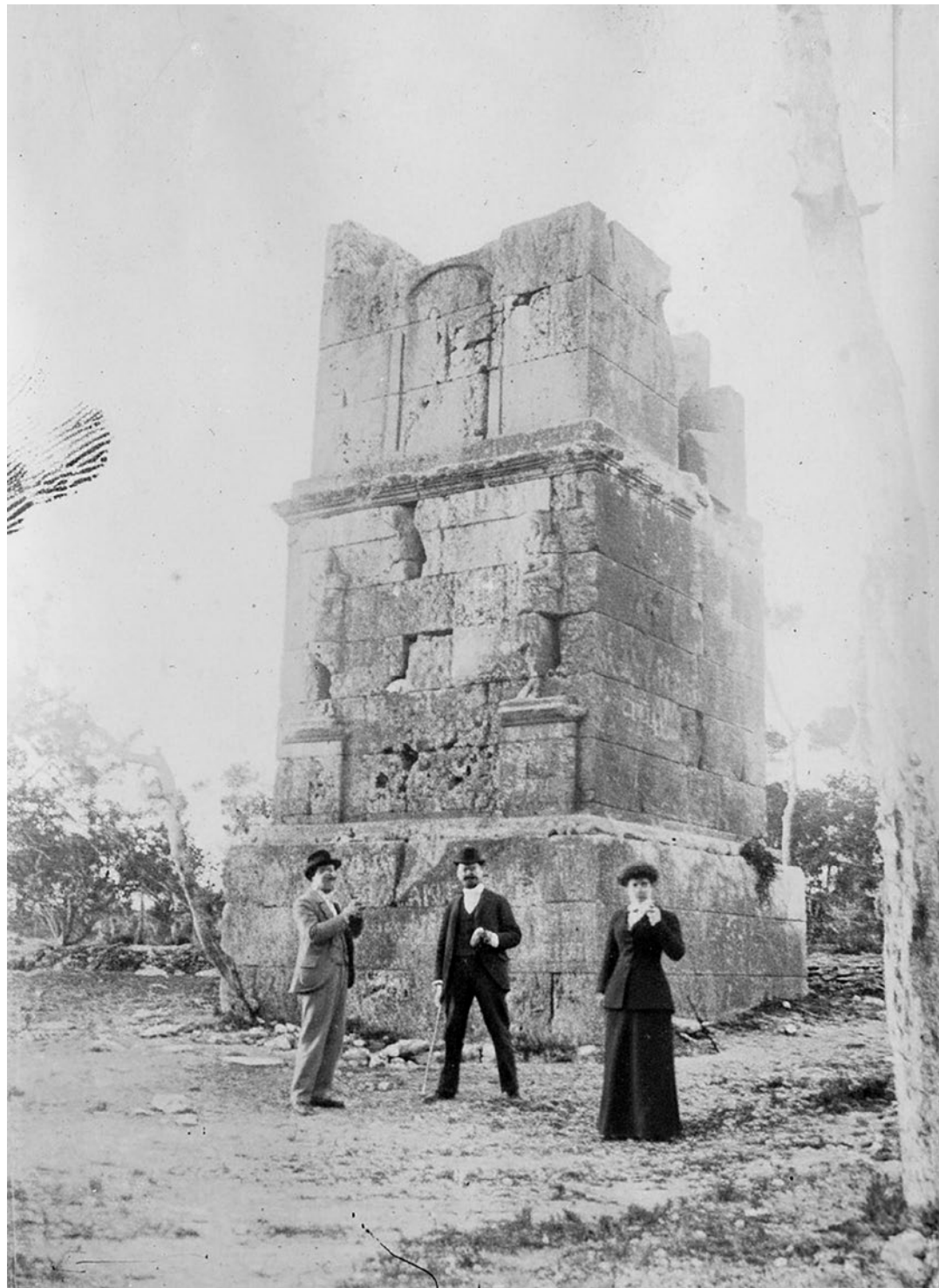
Torre dels Escipions