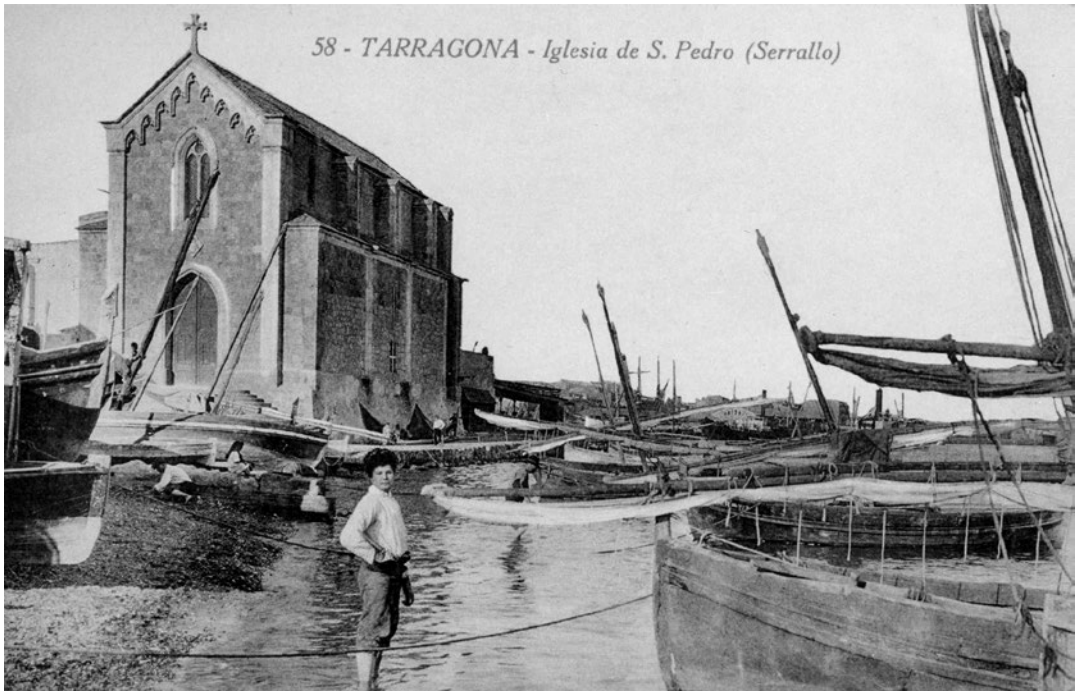
Vista del port de Port Serrallo