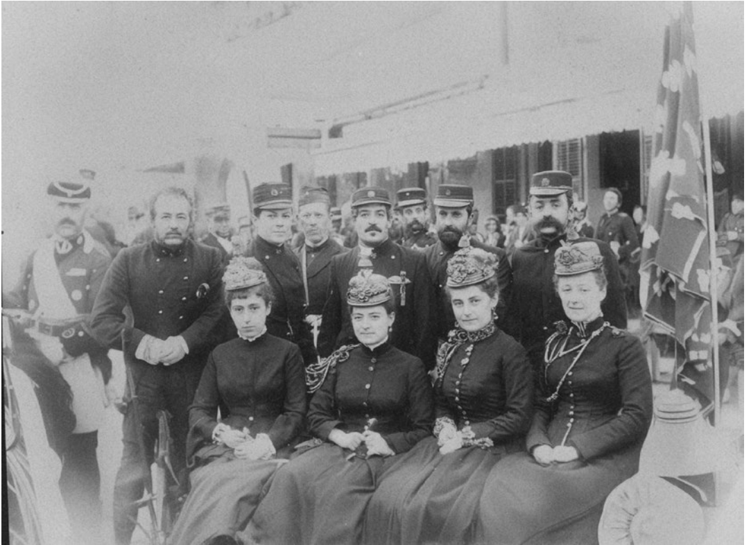
Dones oficials del regiment número 28 de Luchana a Tarragona, foto de grup