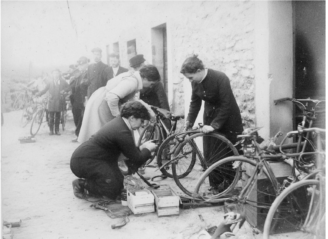
Ciclisme. Grup de ciclistes reparant bicicletes amb indumentària ciclista de finals del segle XIX a principis del segle XX