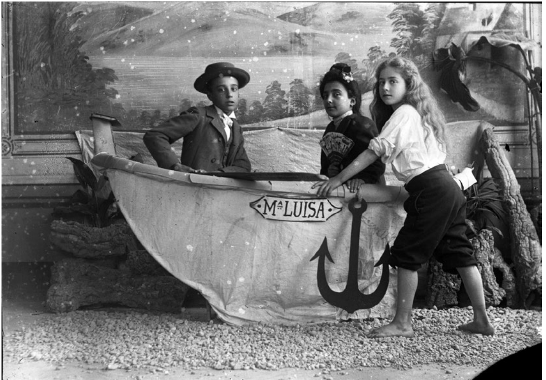
"Caprici Fotogràfic" impressionat per l'adroguer de la plaça dels Carros. Una nena empeny una barca amb la pipa a la boca i els pantalons arremangats