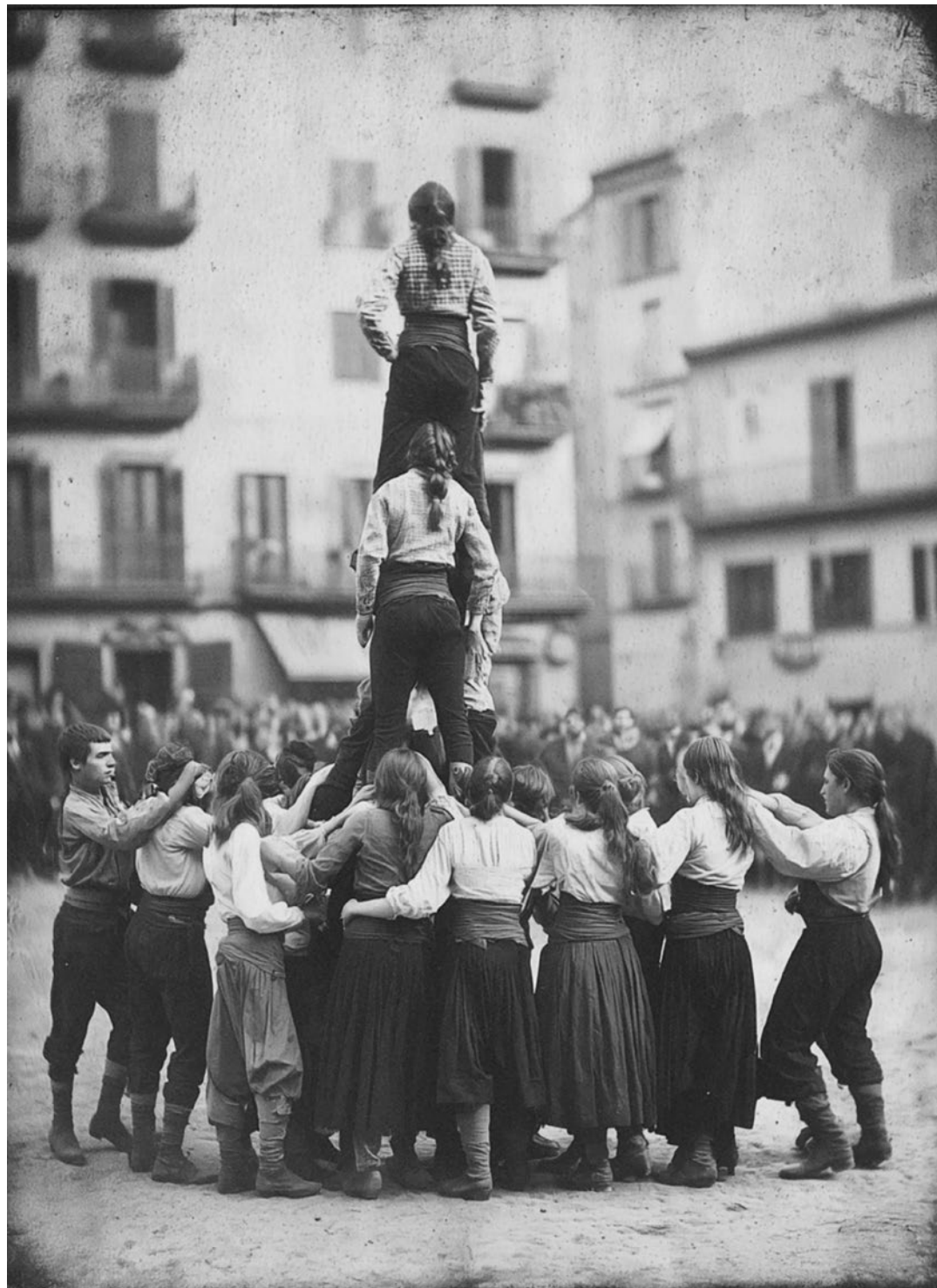
Actuació castellera a la plaça dels Carros (plaça Olószaga). S'hi reconeix un tres de sis