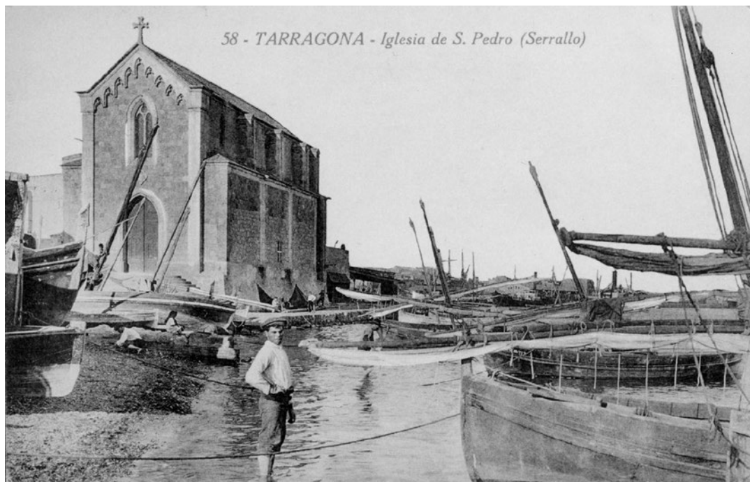
58 - TARRAGONA - Iglesia de S. Pedro (Serrallo)