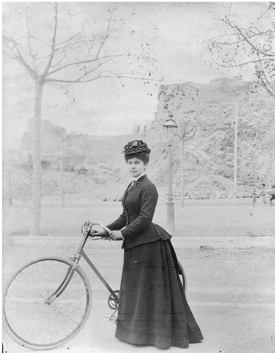
Ciclisme. Ciclista a la rambla Nova