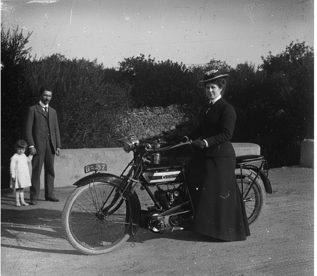
Dona burgesa amb una motocicleta Zenith Gradua. Al fons, el seu marit amb la seva filla petita