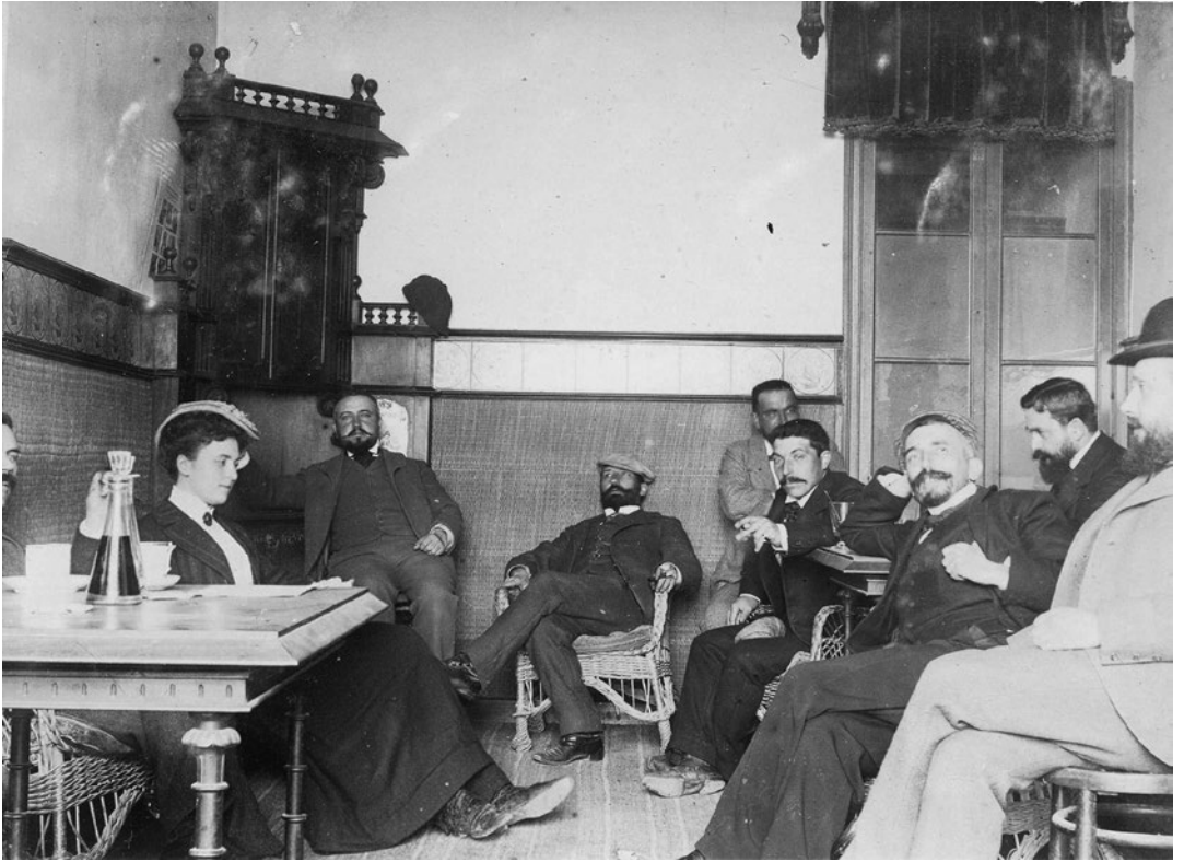
Interior d'una habitació. Grup d'homes i dona, reunits, vestits amb indumentària de finals del segle XIX a principis del segle XX