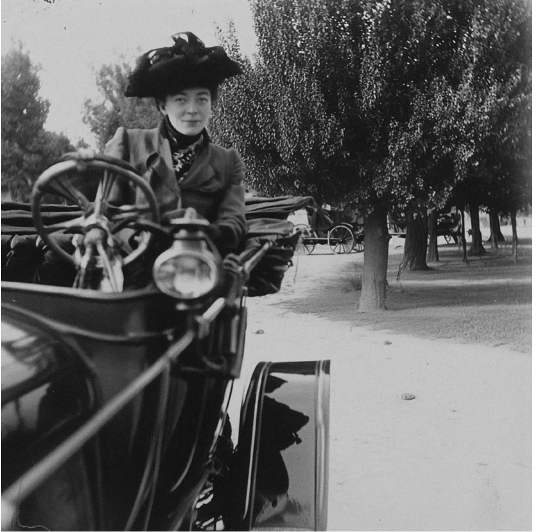
Parc de l'Oest. Una dona conduint un cotxe d'època