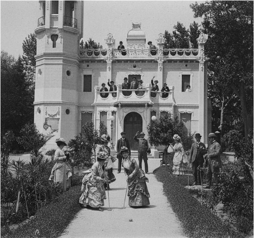
Quinta de Sant Rafael.

Els germans Puig i Valls celebrant una festa de disfresses amb les parelles i amics