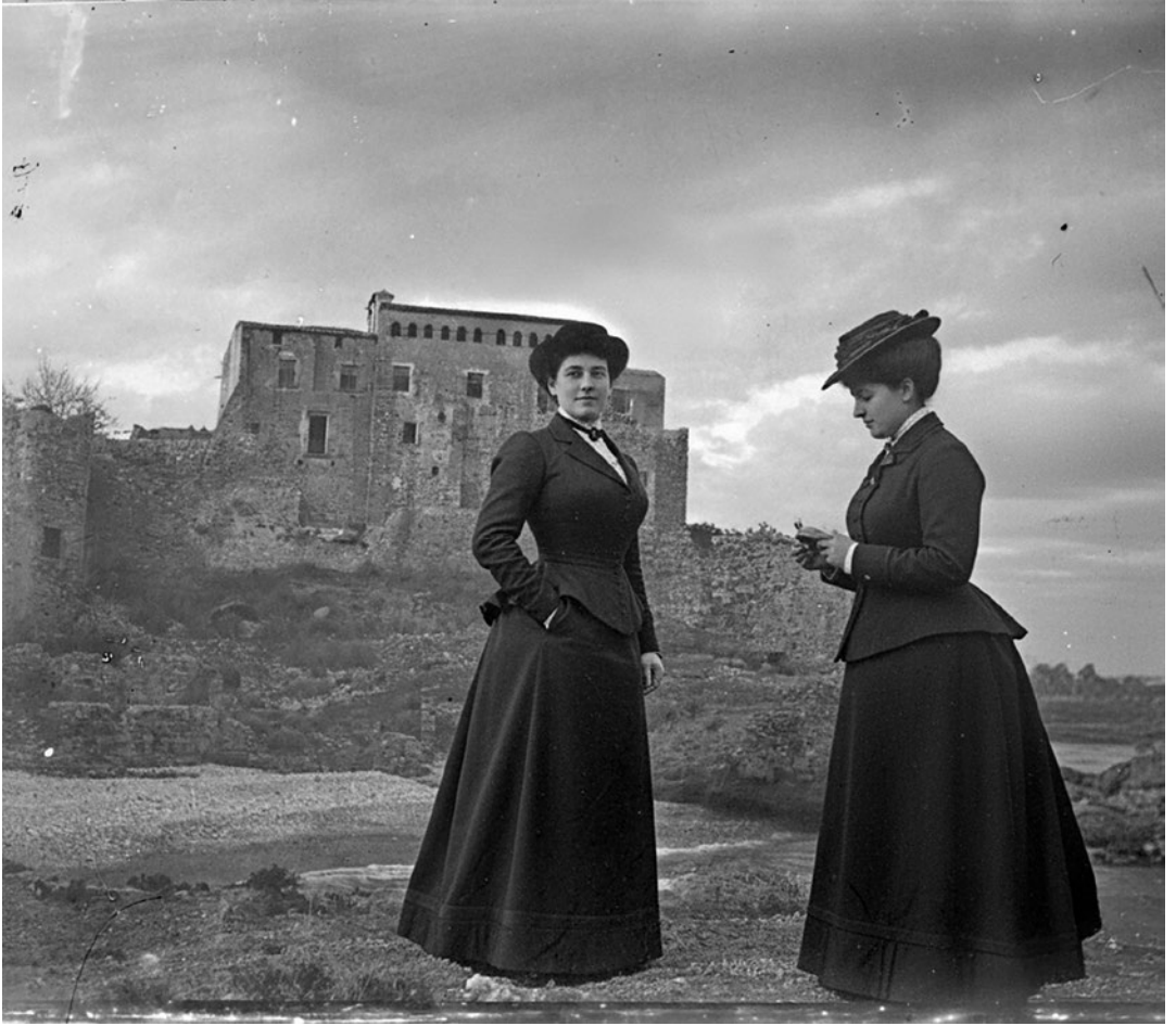
Castell de Tamarit. Dues dones d'excursió