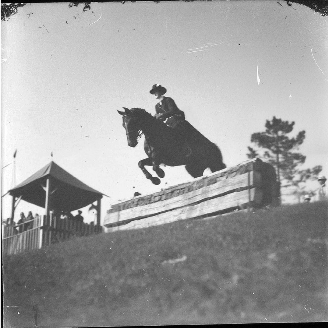
Hípica. Salt i públic