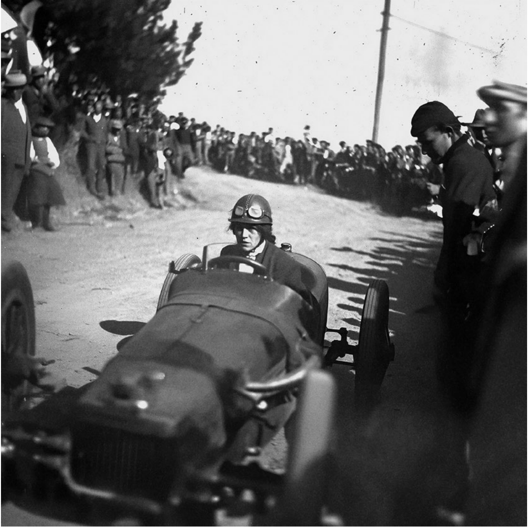
Cursa de cotxes femenina