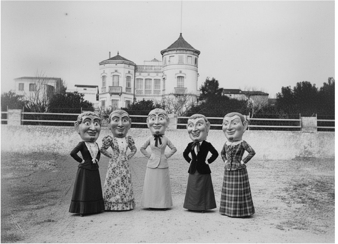
Vista general de Casa Hindú i cinc capgrossos