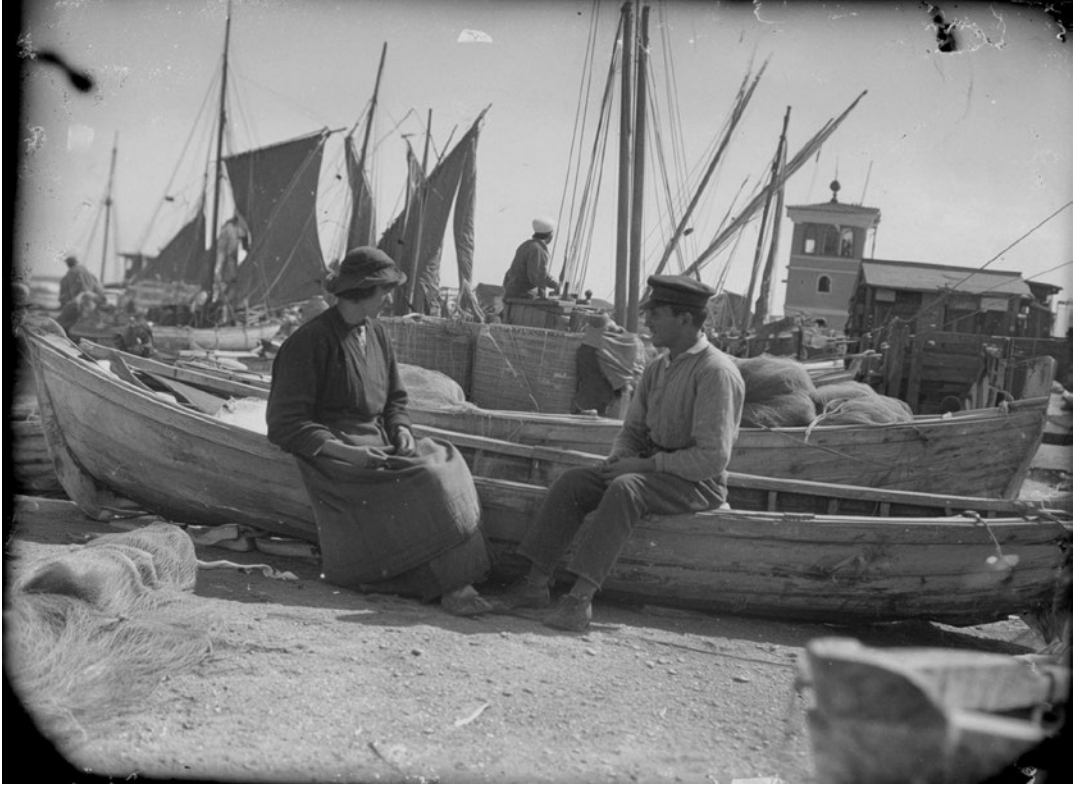
Port de Tarragona. Velers de pesca i dos pescadors conversant