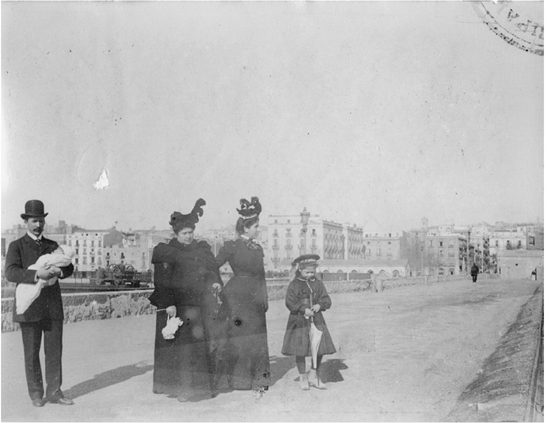
Dic de Llevant. Dues dones, un home, una nena i un nadó, vestits de temps. Al fons, la plaça dels Carros