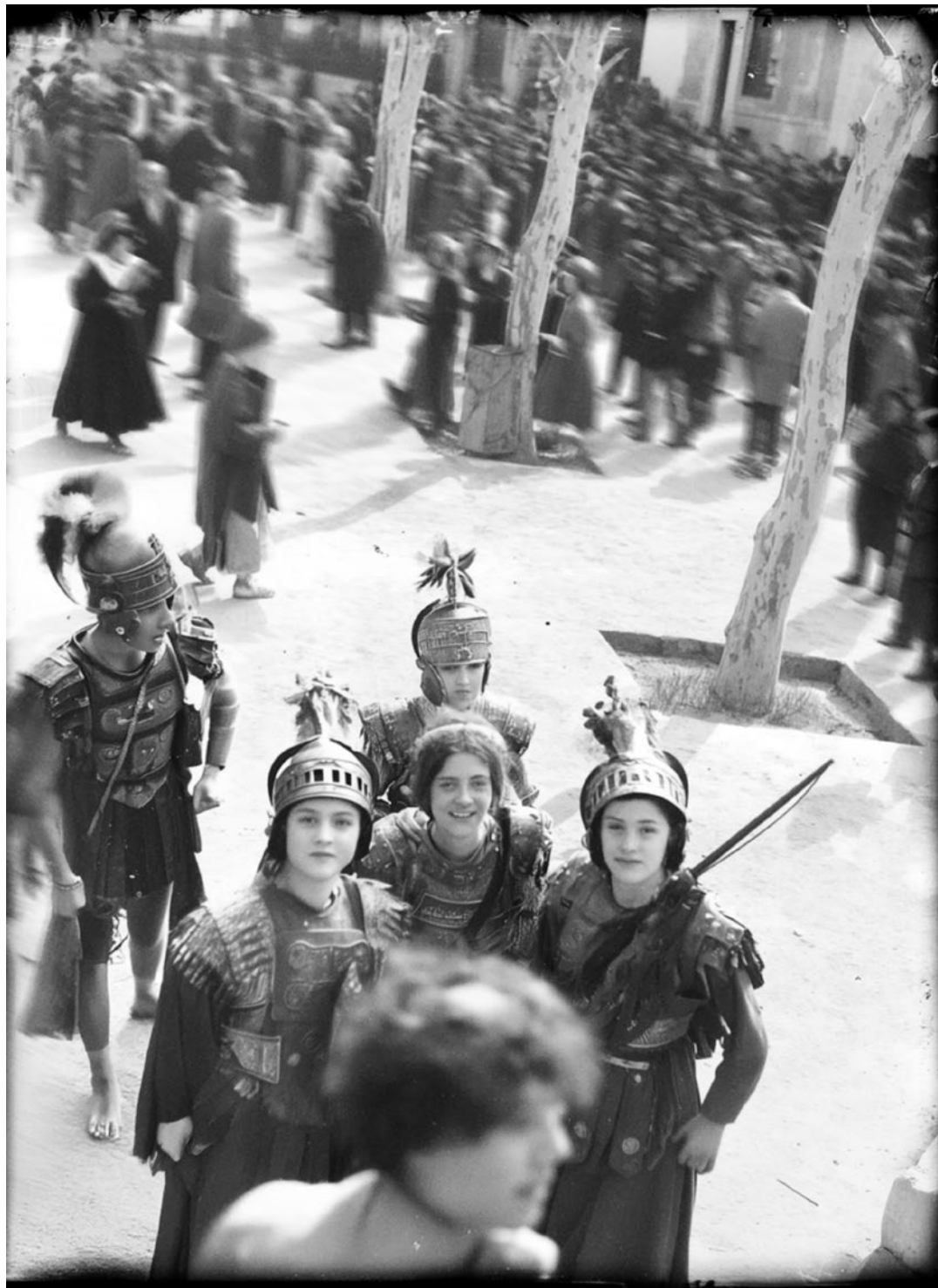
Setmana Santa. Homes i dones armats a la rambla Nova