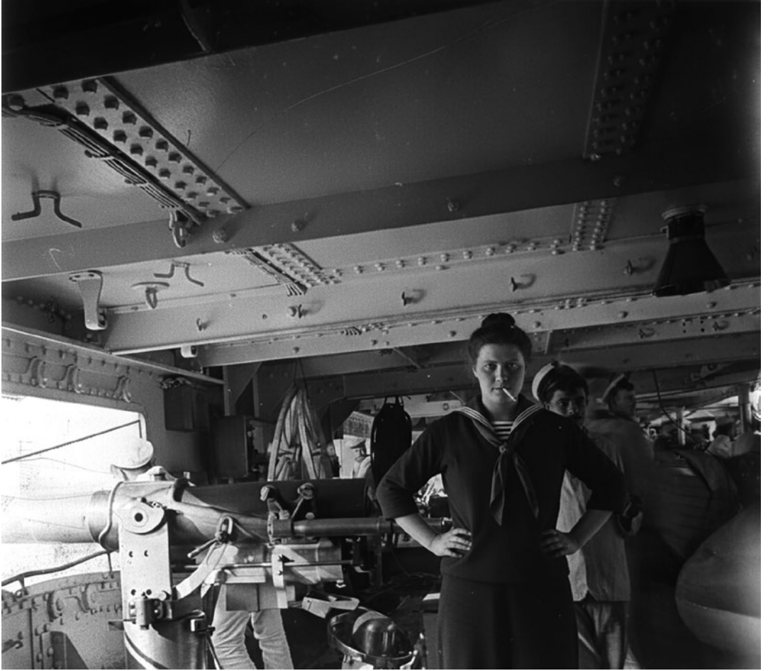
Tripulació i armament d'un torpediner sense identificar