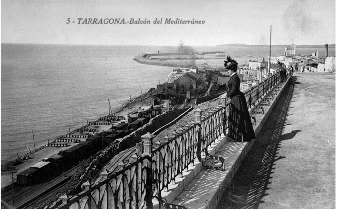
Balcó del Mediterrani. Vista del port i de l'estació de ferrocarril