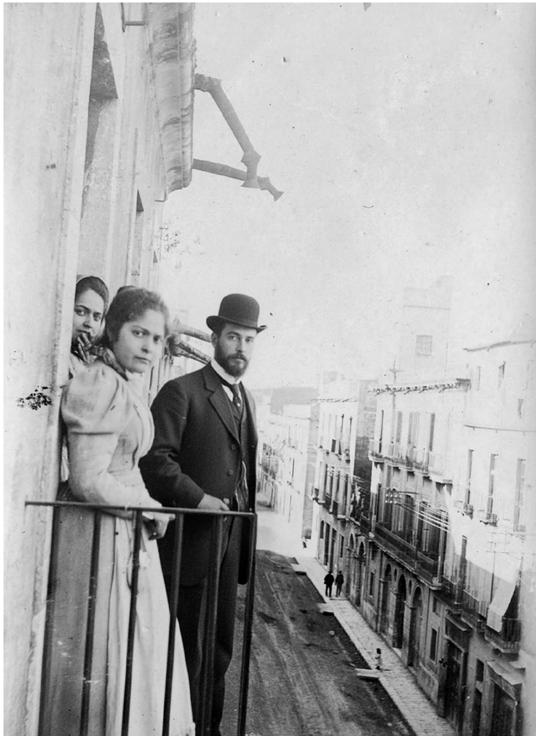
Apodaca, vista general del carrer des de la casa Panasachs. S'hi veuen les sortides d'aigües dels terrats