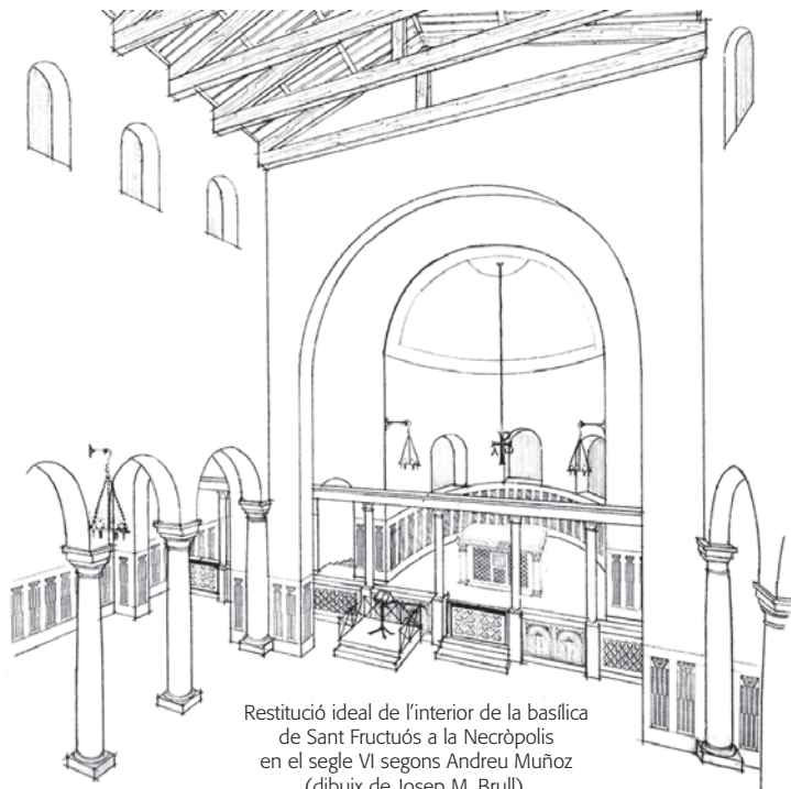
Restitució ideal de l'interior de la basílica de Sant Fructuós a la Necròpolis en el segle VI segons Andreu Muñoz (dibuix de Josep M. Brull).

Fragment d'inscripció memorial (s. V-VI), dedicada als protomàrtirs tarraconenses: [Memoria (?) Fru]ctuosi Au[gurii et Eulogii] i restitució ideal segons Andreu Muñoz, basat en Mn. Serra Vilaró (dibuix de Josep M. Brull). En trama les úniques evidències trobades.