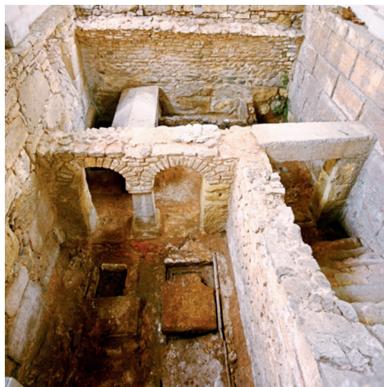
Ubicació de l'absis (fig. 1), de la sepultura número 40 (lauda d'Óptimus) i de la cripta dels Arcs (fig. 2), (Q. Vendrell) i planimetria base de Jordi López.