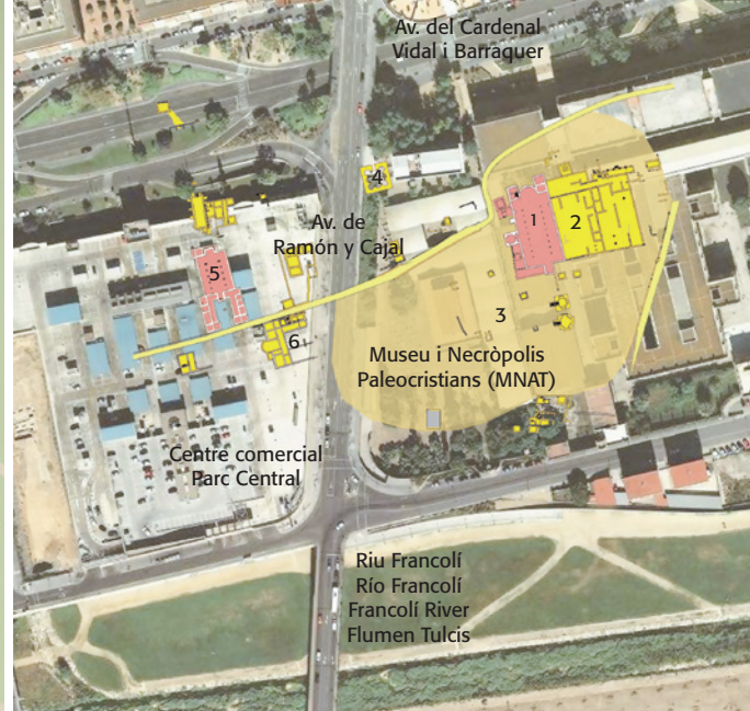
Àrea del santuari de Sant Fructuós al costat del riu Francolí (PAT 2007. Base cartogràfica propietat de l'Institut Cartogràfic i Geològic de Catalunya. Composició UDG / ICAC).