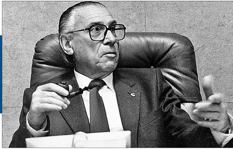
Fotografía tomada en su despacho de la Plaça de la Font el 12 de abril de 1987, a punto de finalizar su segundo mandato como alcalde.