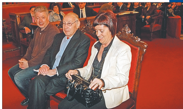
El exalcalde fue nombrado como ‘Fill Predilecte de la Ciutat de Tarragona’ el 18 de marzo de 2009.