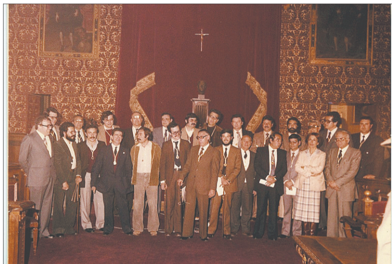
Imagen del primer Ayuntamiento democrático tras el franquismo, fruto de las elecciones municipales del 3 de abril de 1979.