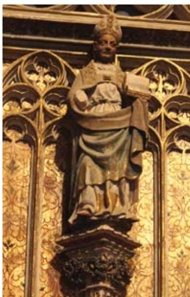
Sant Fructuós (s. XVII), talla de Benet Baró. Catedral de Tarragona (detall)