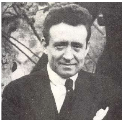
Ricard Opisso i Sala

Entre els artistes, n'hi ha amb poder d'evocació. En retenim les imatges per damunt dels avatars i les contrarietats més crues de la vida. És el cas de Ricard Opisso.