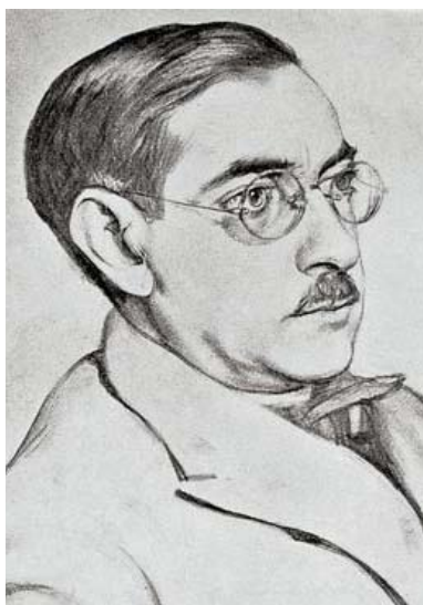
Antoni Rovira i Virgili en un retrat de Ferran Callicó (1928)

Per a nosaltres, la gent de Tarragona, hi ha un nom que representa una parcel·la fonamental de la nostra dignitat, el nom d'Antoni Rovira i Virgili. Els seus textos, llegits gairebé d'amagat, descoberts en el silenci, ens acostaven a l'autèntica consciència del nostre poble, ens omplien de contingut paraules malbaratades com pàtria o llibertat.