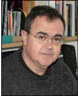
FRANCESC TARRATS I BOU

Descendent –per banda paterna– d'una família de menestrals i comerciants i –per banda materna– d'una altra d'artesans, tots ells residents a la Part Alta de Tarragona, Bonaventura Hernández Sanahuja va néixer al carrer de la Merceria d'aquesta ciutat el 30 de maig de 1810, on havia de morir el 9 de novembre de 1891.