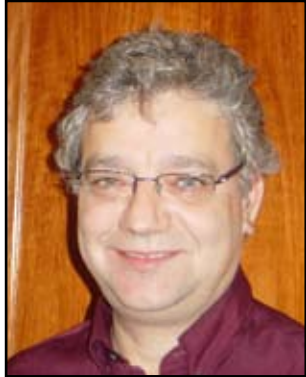
JOSEP SÁNCHEZ I CERVELLÓ

P olític, mestre, periodista i escriptor. Estudià magisteri a Tarragona i, en acabar-lo, marxà a Tortosa, on s'inicià políticament escrivint a El Pueblo , òrgan de la Unió Republicana. Fundà una escola laica a Roquetes el 1906. A les municipals del 1909 va ser elegit regidor per Tortosa i el 1914 esdevingué el primer diputat republicà per aquell districte, del qual fou reelegit en diverses ocasions. Fou el líder del Bloc Republicà Autonomista el 1915 i director del seu òrgan, La Publicitat , però la incapacitat per acabar amb l'hegemonia de la Lliga féu que, el 1917, impulsés el Partit Republicà Català, que dirigí, convertint-se en un referent polític de Catalunya per les campanyes autonomistes i contra la Guerra del Marroc. Per això fou detingut l'agost del 1917. Igualment durant la dictadura de Primo de Rivera tornà a ser empresonat (1924, 1926, 1929), deportat de la demarcació (1928) i, finalment, exiliat. A l'agost del 1930 participà al Pacte de Sant Sebastià, formant part del Comitè Revolucionari encarregat de dur la República i també fou membre del Comitè Executiu d'ERC (març 1931), compatibilitzant aquesta militància amb la del Partido Republicano Radical Socialista Español, que havia fundat el 1929. Amb el canvi de règim encapçalà la llista republicana de la demarcació a les constituents del 1931, essent el candidat més votat, amb 68.073 vots. El gener del 1932 va sortir d'ERC perquè