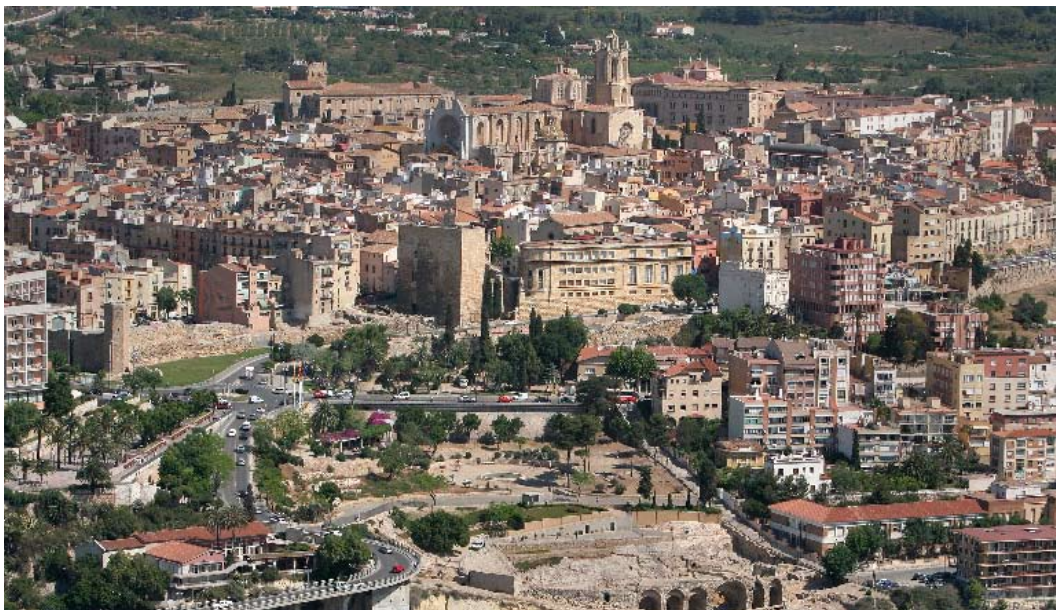
Vista panoràmica de Tarragona

L'existència mil·lenària de Tarragona és tan singular i captivadora que no pot passar desapercebuda. No en va, l'esplèndid llegat històric de Tàrraco li val el títol de ciutat Patrimoni Mundial.