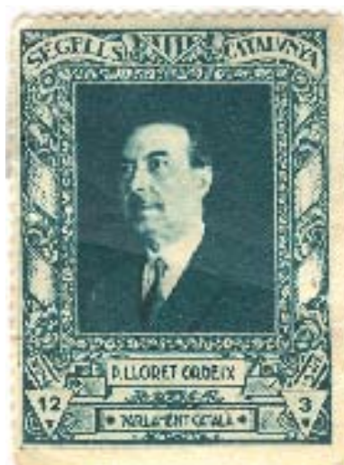
CEDIT PER TERESA LLORET CARBÓ. AMT Segell del Parlament de Catalunya amb la imatge del diputat Pere Lloret i Ordeix