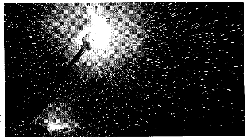
Los "diables" despedirán hoy la fiesta de Tortosa. VICENÇ LLURBA